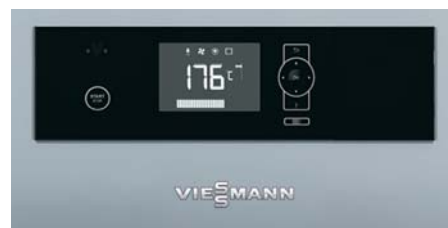
Regelung Ecotronic 100 mit beleuchtetem Display für einfache und intuitive Bedienung

Der kompakte Scheitholzessel ist auch eine hervorragende Wärmeergänzung von bestehenden Öl- oder Gas-Heizungsanlagen. Dann übernimmt er im bivalenten Betrieb die Grundversorgung mit Heizwärme und Warmwasser. Erst bei extrem niedrigen Temperaturen wird der konventionelle Heizkessel zur Abdeckung der benötigten Spitzenlast zugeschaltet.