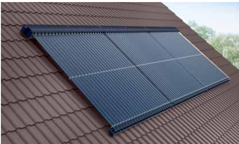
Universell einsetzbar durch lageunabhängige Montage, senkrecht oder waagrecht, auf Dächern und an Fassaden sowie zur freistehenden Montage.

Im Servicefall können die Heatpipe-Röhren aufgrund der Trockenanbindung auch bei befüllter Anlage schnell und einfach ausgetauscht werden.