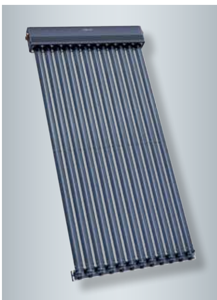
Hochleistungs-Vakuum-Röhrenkollektor Vitosol 300-TM (Typ SP3C)